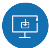
公開ソフトウェア