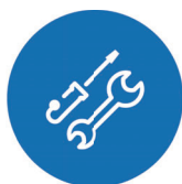
社内ツール&アプリ