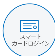
スマート カードログイン