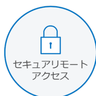
セキュアリモート アクセス