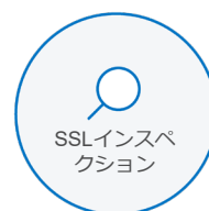
SSLインスペ クション