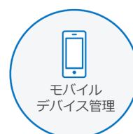
モバイル デバイス管理

信頼できるデバイスIDを確立し、モバイルデバイス管理ソリューションを完成させます。