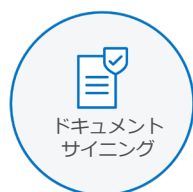
ドキュメント サインング

信頼できるデバイスIDを確立し、モバイルデバイス管理ソリューションを完成させます。